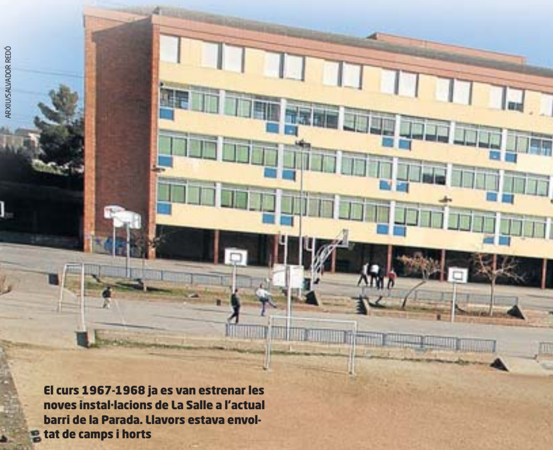
El curs 1967-1968 ja es van estrenar les noves instal·lacions de La Salle a l'actual barri de la Parada. Llavors estava envoltat de camps i horts

El col·legi va anar evolucionant en funció dels nous estudis, de les noves realitats polítiques i socials. I així va ser que el curs 1977-1978 van començar les classes mixtes: 12 noies entraven a fer primer de BUP en una escola reservada només per als nens des del seu inici. Els canvis socials també es van notar a la comunitat. Des dels anys 60 va anar disminuint progressivament la presència de religiosos i s'hi van anar incorporant professors i professores seglars. Actualment a La Salle hi ha quatre germans, que no són docents. L'últim gran canvi que ha experimentat l'escola ha estat la construcció del parvulari, que es va estrenar l'octubre del 2004, amb la qual cosa ha tancat el cercle de l'ensenyament, ja que a La Salle s'hi pot cursar tots els estudis abans d'entrar a la universitat.